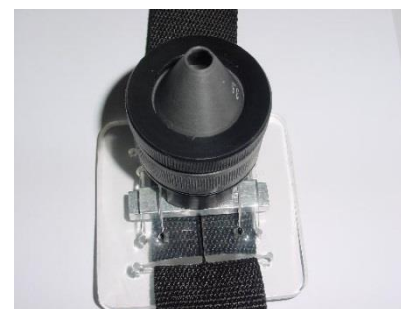
Gurt (einfach o. antistatisch) für Befestigungselement (bitte extra bestellen – Artikel-Nr.: 00059)