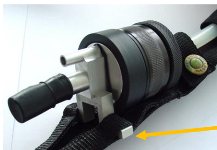
Gurt (einfach) mit integrierter Halterung (Lasche)