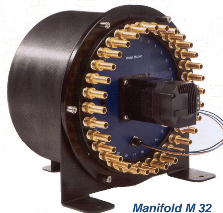
Manifold M 32

TECHNISCHE ÄNDERUNGEN UND IRRTUM VORBEHALTEN